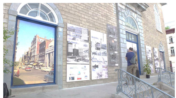
Exposition « Saint-Roch : à pied, à cheval, en voiture »

L'exposition se composait d'une dizaine de photographies historiques provenant des archives de la Ville de Québec. Elle se divisait en cinq panneaux mêlant photographies et explications ainsi que trois œuvres tissées au métier Jacquard par la Maison des métiers d'art de Québec représentant des agrandissements de photographies mettant en valeur certaines parties du quartier Saint-Roch.