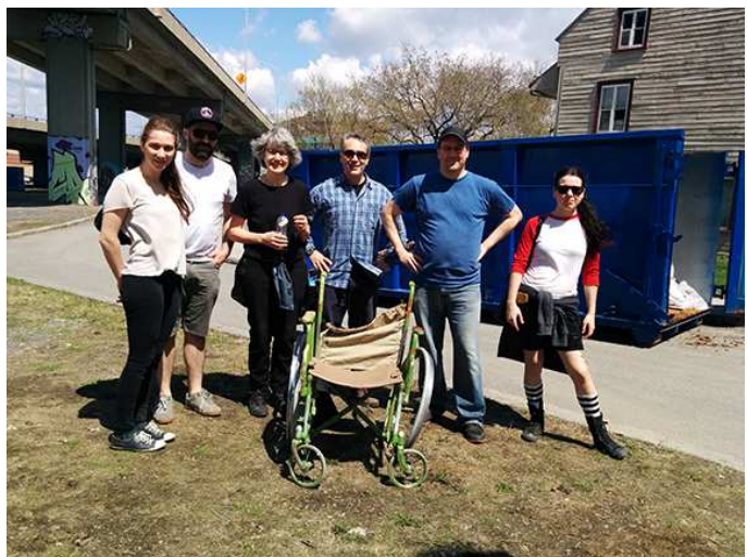
La corvée citoyenne

Six corvées ont été réalisées entre le 14 et le 28 mai par les différents organismes partenaires. Le conseil de quartier Saint-Roch et La Société de développement commercial (SDC) centre-ville ont participé au nettoyage du secteur sous les bretelles d'autoroute et des abords de l'escalier des Glacis ; la Table de quartier l'EnGrEnAgE de Saint-Roch a nettoyé les abords de l'église Saint-Roch ; Verdir et Divertir, la falaise bordant le sud de l'îlot des tanneurs (notamment l'arrachage d'une plante envahissante : la renouée du Japon) ; l'Accorderie, autour de l'église Notre-Dame-de-Jacques-Cartier ;