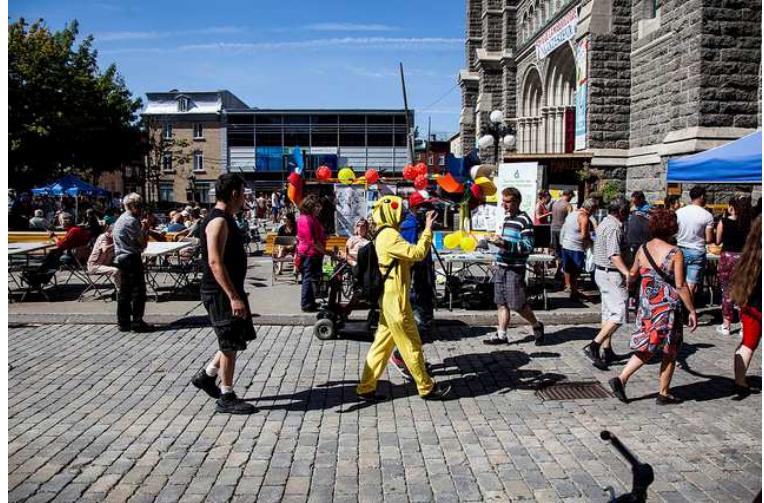
Parvis en fête, photo de l'EnGrEnAgE

Une scène offrait des prestations musicales, la rue était animée par divers kiosques, jeux et concours pour toute la famille. Un excellent repas gratuit était offert, axé sur des produits santé et végétariens préparés avec la collaboration de la cuisine collective Le Bourg-joie. Afin de souligner la présence d'entreprises technologiques dans le quartier, des activités spécifiques s'adressaient aux adeptes du jeu Pokémon Go qui ont été nombreux à participer.