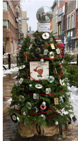
Arbre décoré par Peak Media

Ce projet, en plus d'encourager la collaboration entre les acteurs du milieu, a permis d'égayer le quartier durant le temps des fêtes et d'augmenter le sentiment d'appartenance au quartier. De plus, les citoyens et visiteurs du quartier étaient invités à voter pour leur sapin préféré via un concours Facebook. Le sapin gagnant est celui de la Joujouthèque Basse-Ville.