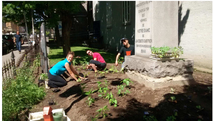
Jardin de la Nef

En partenariat avec la concertation citoyenne Verdir Saint-Roch, le conseil de quartier s'est impliqué dans la réalisation de projets satellites de verdissement. Ces projets visaient à faire rayonner l'agriculture urbaine à travers le quartier par l'entremise de petites surfaces regorgeant de plantes comestibles, constituant autant de vitrines pour la lutte aux îlots de chaleur. Selon les partenariats convenus avec des organismes, commerçants et citoyens du quartier et l'espace disponible à chaque endroit, des plantes comestibles ont été plantées, en bacs ou pots, suspendues ou au sol, au sein de surfaces gazonnées, autour d'arbres, etc. La contribution du conseil de quartier Saint-Roch a rendu possible l'achat de matériaux tels que du bois, de la terre à plantation et des végétaux, ainsi que l'achat de bacs.