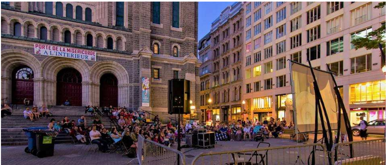
Projection de film sur le parvis de l'église Saint-Roch

Cette activité a permis d'animer les espaces publics du quartier et de présenter une offre culturelle accessible à la population de Saint-Roch en plus de favoriser la mixité sociale et de développer un sentiment d'appartenance à différents lieux du quartier. Au total se sont plus de 450 personnes qui ont assisté à l'une ou l'autre des représentations. Les films ont été projetés sur un écran blanc et les personnes s'installaient sur leur couverture ou des chaises pour regarder les films.