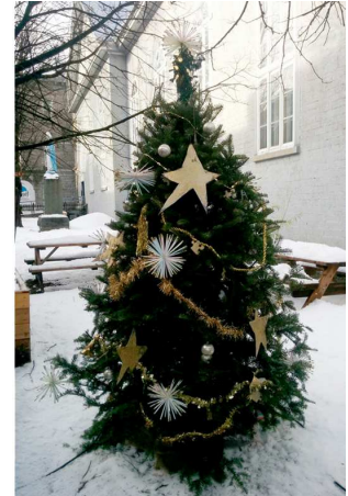
Arbre décoré par la Joujouthèque Basse-ville