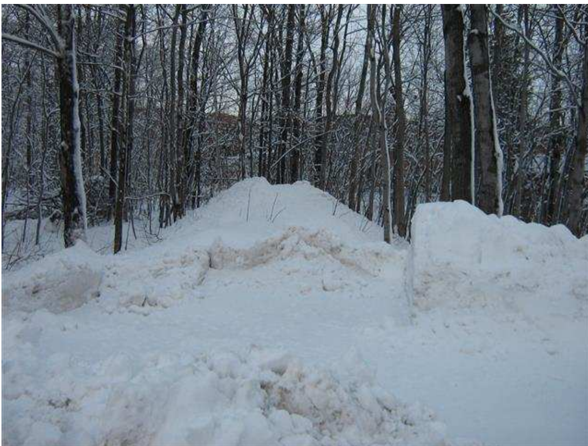
Déversement illégal de neige dans le Boisé du Campanile

Plusieurs enjeux ont été cette année la cible de nos interventions. Nous avons fait des interventions pour tenter de faire déneiger le sentier piétonnier de la rue Bégon afin de permettre à plusieurs élèves de l'école primaire Saint-Benoît d'avoir à faire un long détour l'hiver pour se rendre à leur école. Nous avons aussi tenté de faire cesser la projection illégale de neige dans le Boisé du Campanile. Malheureusement, aucune de ces interventions n'a porté fruit jusqu'à ce jour.