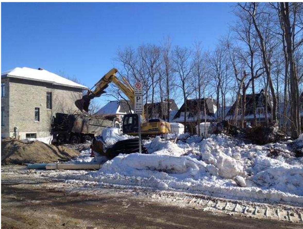
Coupe à blanc d'un terrain sur la rue Paul-Archambault

Au meilleur de notre connaissance, nous avons poursuivi nos interventions pour faire progresser le projet de reconstruction du Centre communautaire Pie-XII afin d'augmenter l'espace communautaire disponible, améliorer la qualité des locaux et y adjoindre des logements sociaux sur les étages supérieurs. Conséquemment, nous avons réalisé un travail de sensibilisation auprès des membres du conseil d'arrondissement et de la Ville de Québec quant à l'urgence d'agir dans ce dossier. Le conseil de quartier a par ailleurs maintenu ses actions dans les principaux chantiers couverts par son plan d'action, soient les chantiers « Économie et Habitat », « Architecture et aménagement urbain », « Environnement et espaces verts », « Gestion des déplacements » et « Culture, loisirs et vie de quartier ».