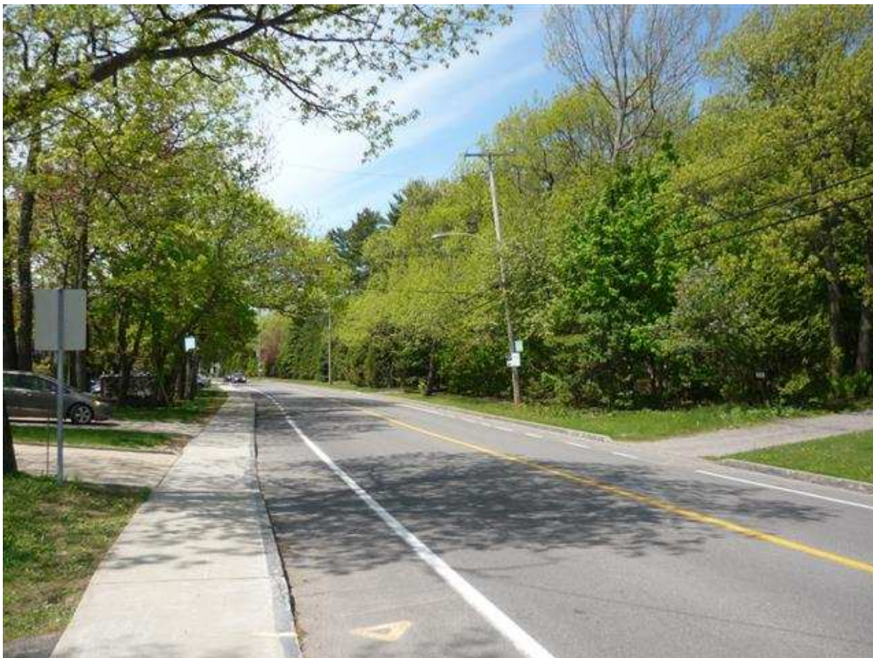
Bande boisée sur le côté nord du chemin Saint-Louis entre les rues des Compagnons et Valentin

Compagnons afin de protéger une bande boisée en bordure du chemin Saint-Louis et de faire ouvrir la future rue sur la rue Valentin ou sur le boulevard Neilson plutôt que sur le chemin Saint-Louis. Nous avons reçu une réponse négative de la Ville de Québec. Depuis 2009, et ce conjointement avec d'autres conseils de quartier, le conseil de quartier de la Pointe-Sainte-Foy tente de faire classer l'axe patrimonial de la Grande Allée et le chemin Saint-Louis pour assurer la protection de ses paysages naturels. Une étude de caractérisation du chemin Saint-Louis devait être complétée et rendue publique à l'automne dernier par la Ville de Québec. Nous attendons toujours le dévoilement de cette étude et des mesures de protection qui devraient être mises en place pour conserver l'aspect patrimonial bâti et naturel de cet axe.