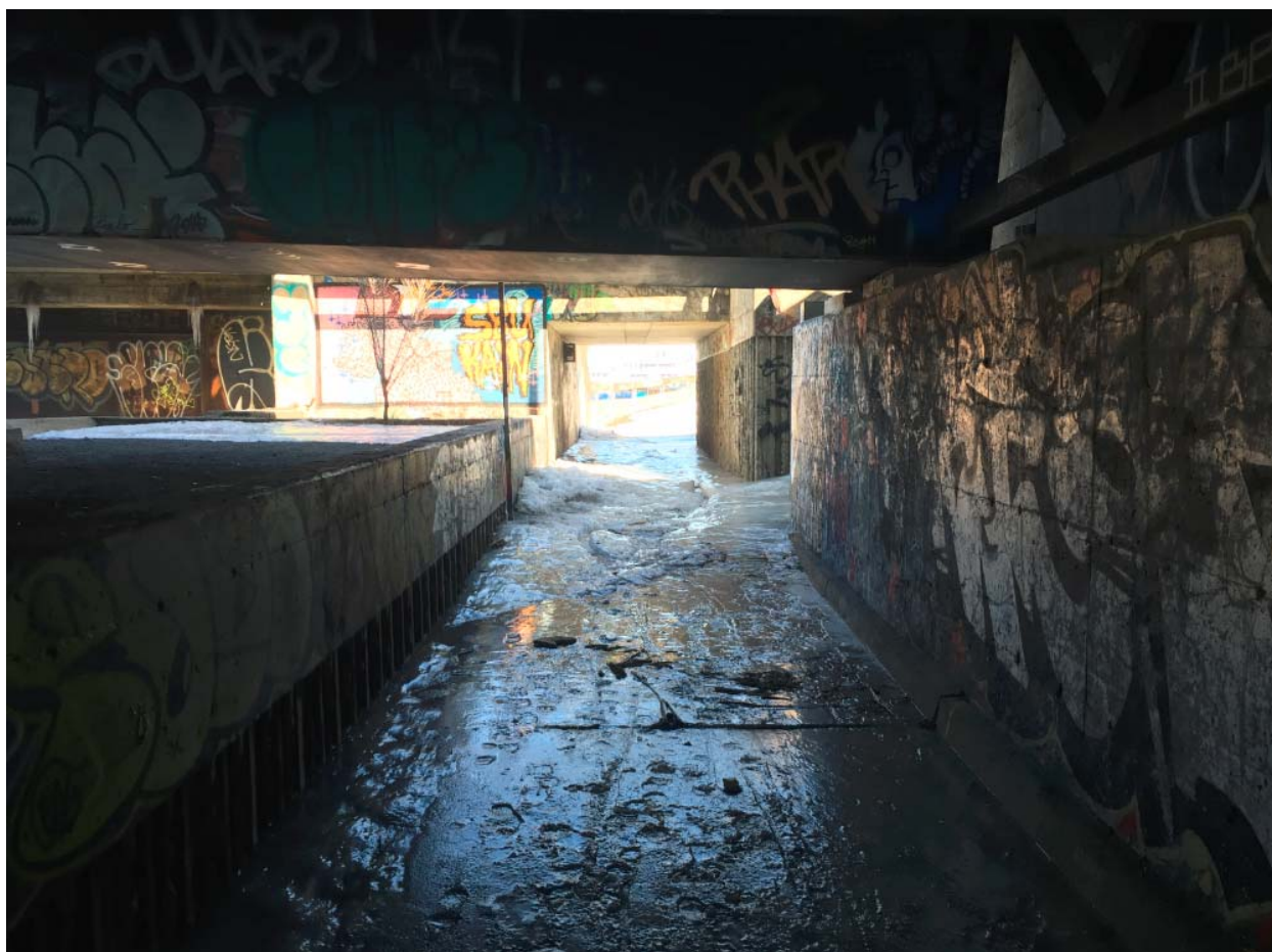
Photo 4 – 10 Avril 2016 (l’an dernier) – Même situation avec une épaisse couche de glace