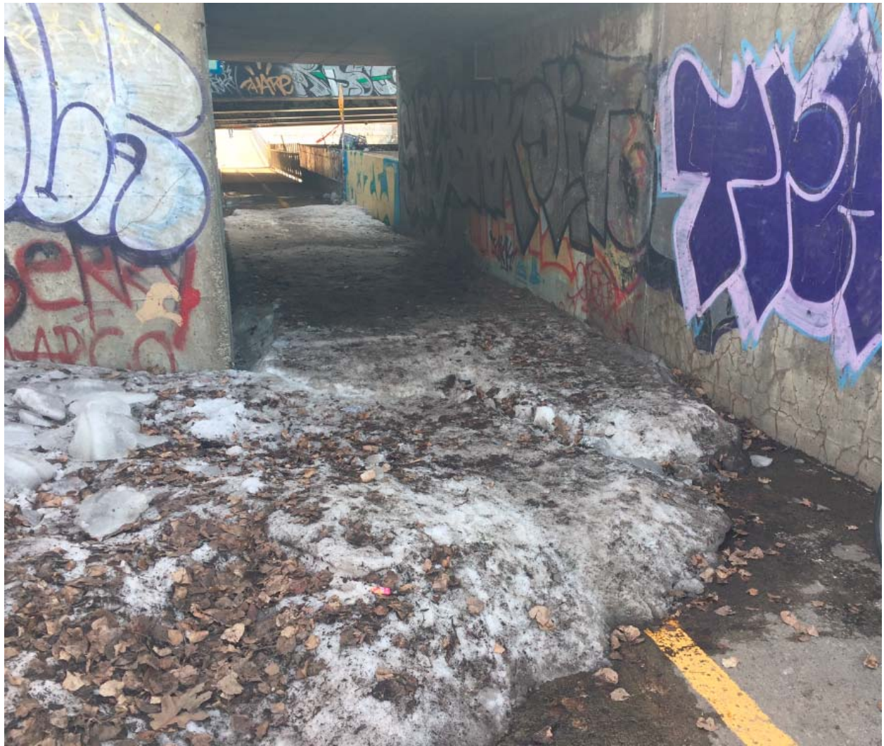
Photo 3 – Glace sous le pont Samson le 18 Avril 2017 alors que la piste piéton/cycliste de la rivière St-Charles est déjà praticable sur toute sa longueur.