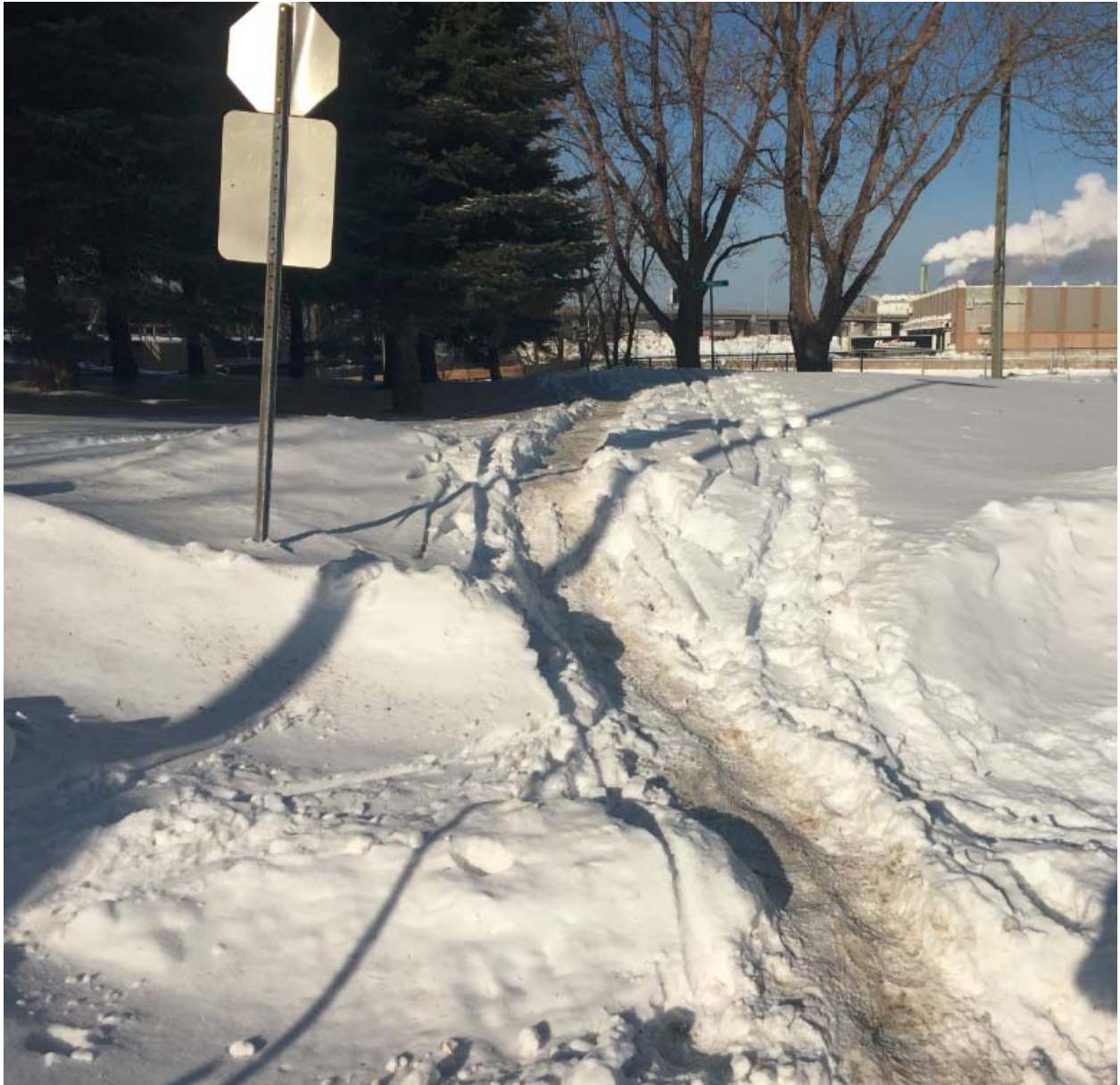
Photo 1 – 9 janvier 2017 – Les piétons doivent se frayer un passage en absence de déneigement