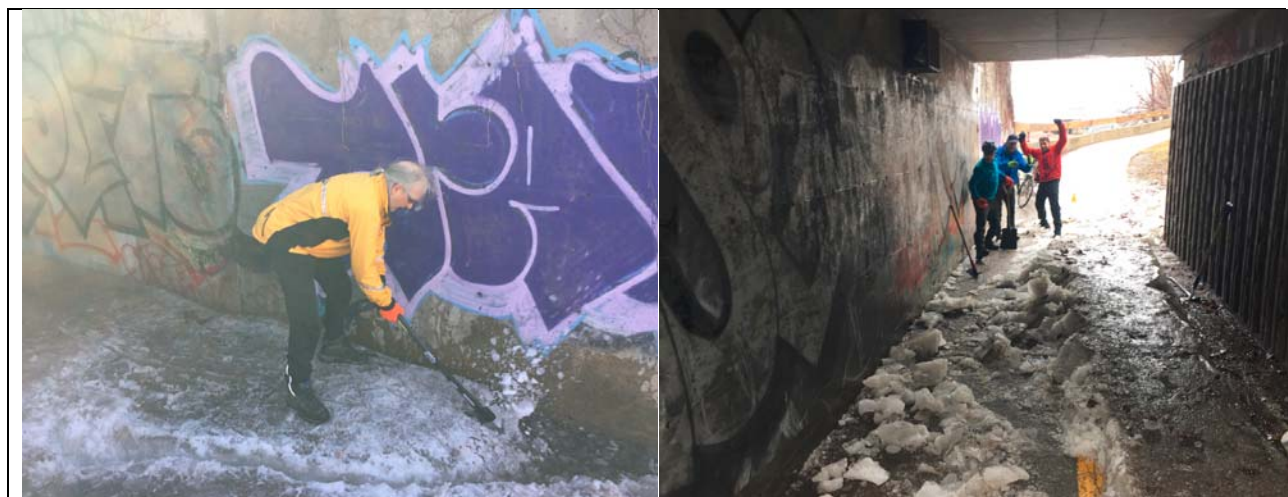
Photos 5,6 – Pierre Bérubé, le citoyen, qui assisté de bénévoles, s’occupe depuis 5 ans de rendre praticable la piste multifonctionnelle sous le pont Samson. Photo 5 (première corvée du 14 Avril 2017). Photo 5 (deuxième corvée du 22 avril 2017)