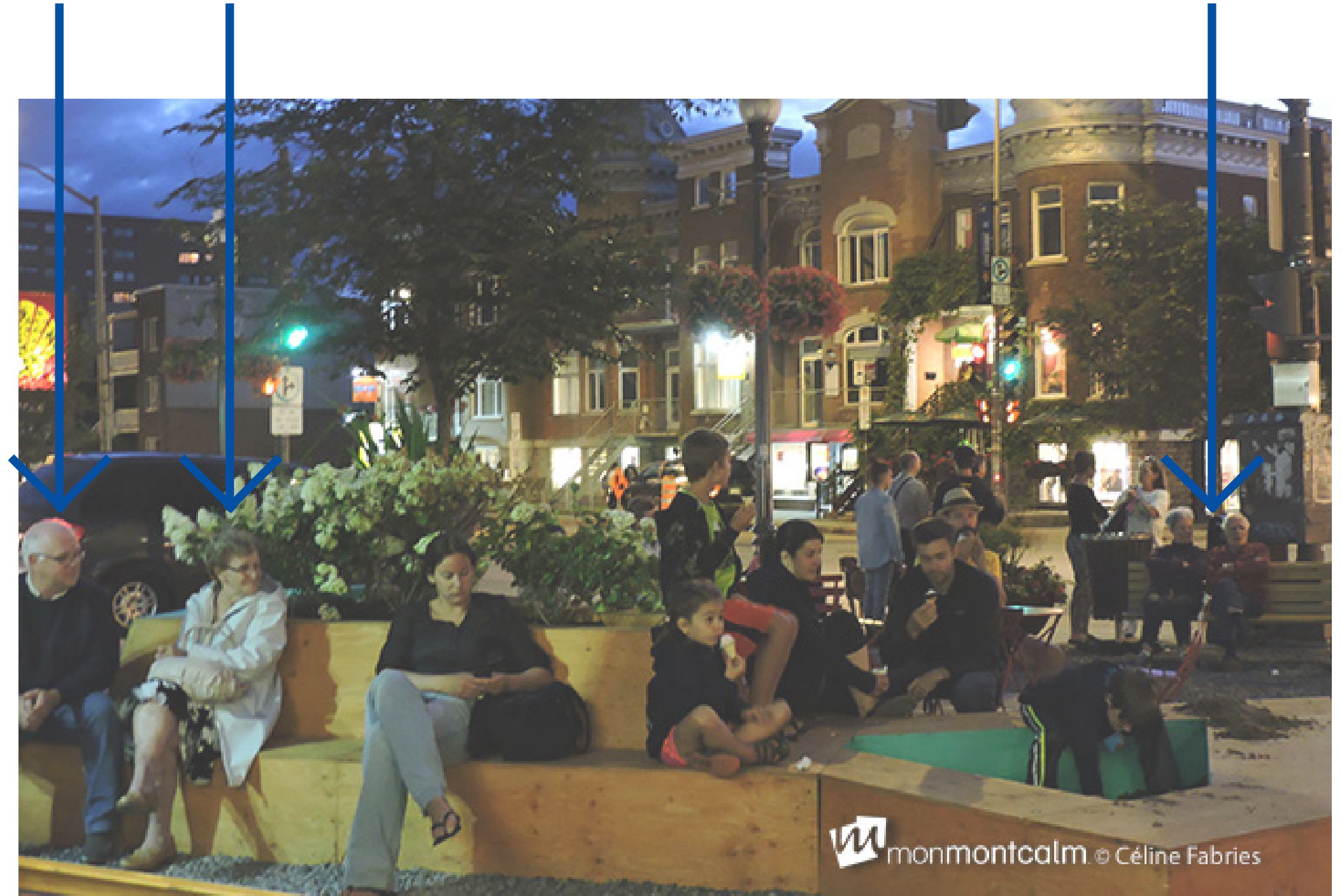
Le mobilier urbain à l'intérieur de l'aménagement temporaire à l'été 2015, à l'intersection de l'avenue Cartier/boul. René-Lévesque dans le quartier Montcalm.