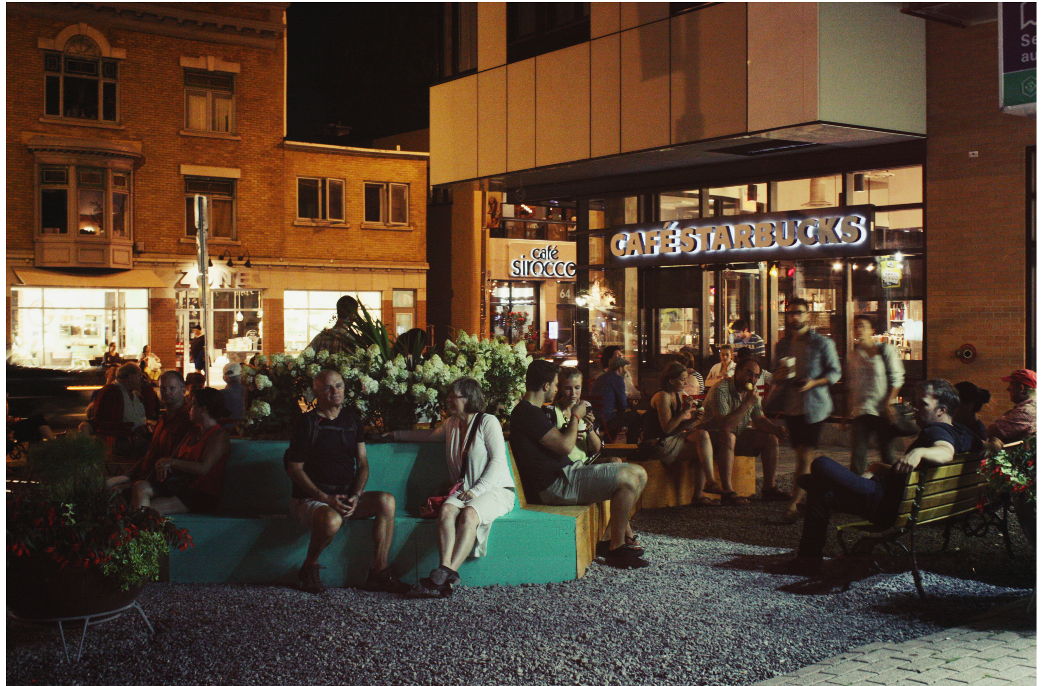
Le mobilier urbain à l'intérieur de l'aménagement temporaire à l'été 2015, à l'intersection de l'avenue Cartier/boul. René-Lévesque dans le quartier Montcalm.

Contribution à l'aménagement temporaire par l'insertion d'un mobilier urbain en bois via une initiative citoyenne.