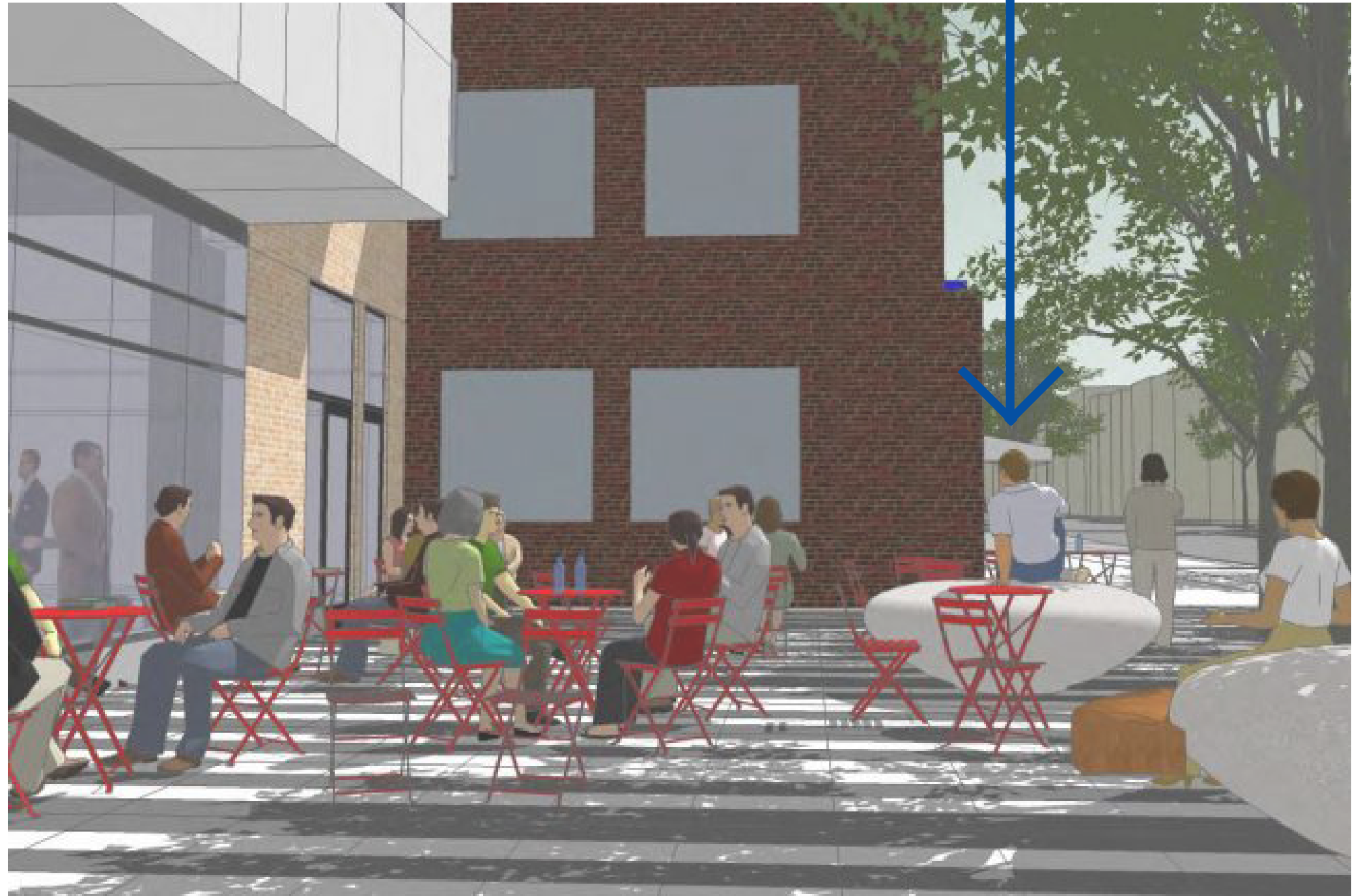
Concept d'aménagement permanent pour la place publique au coin de l'avenue Cartier et du boulevard René-Lévesque.

Ces observations pourront être également présentées lors du conseil d'arrondissement comme appui au propos du travail de groupe, citoyens-conseil de quartier.