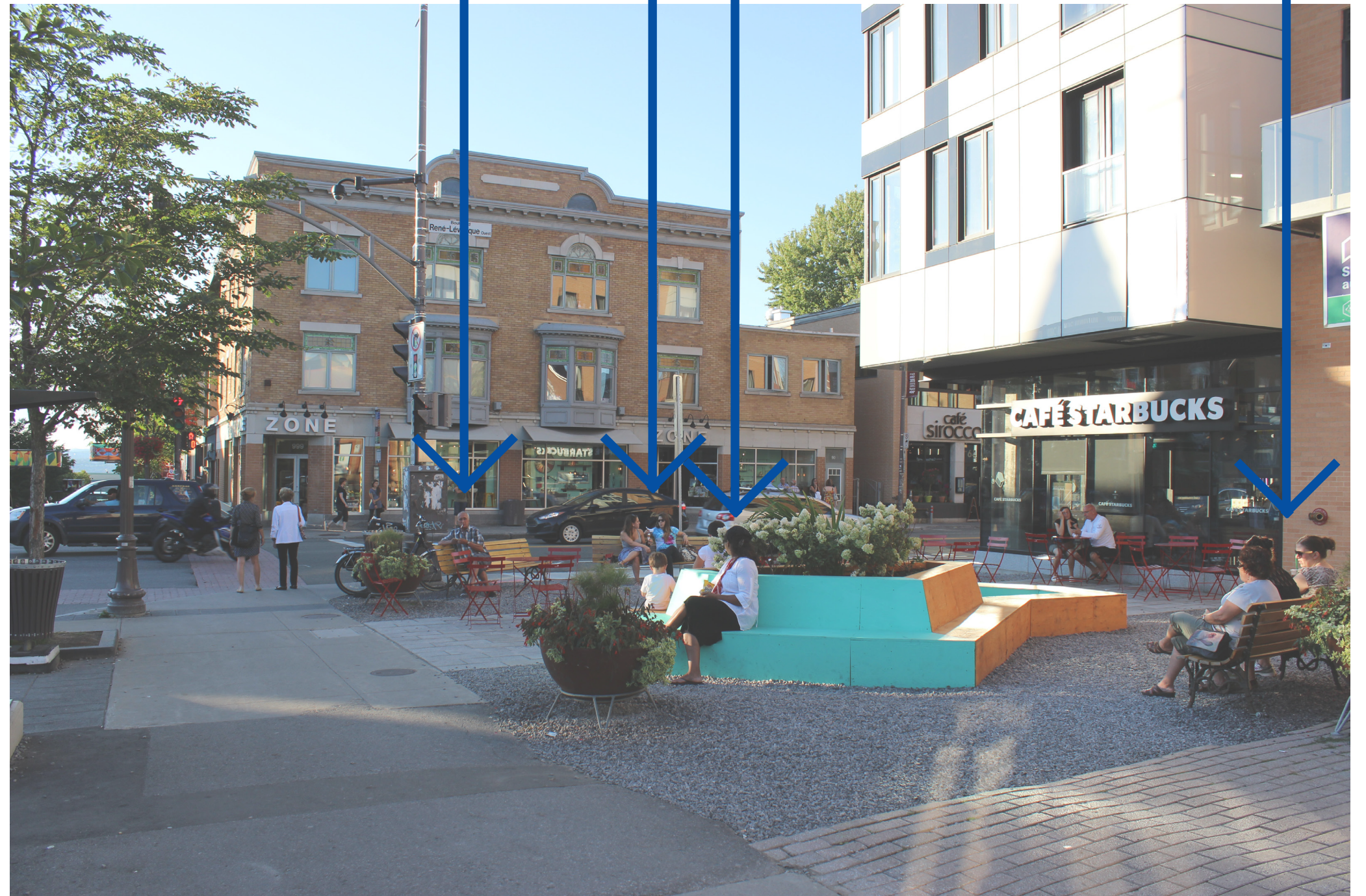
Le mobilier urbain à l'intérieur de l'aménagement temporaire à l'été 2015, à l'intersection de l'avenue Cartier/boul. René-Lévesque dans le quartier Montcalm.