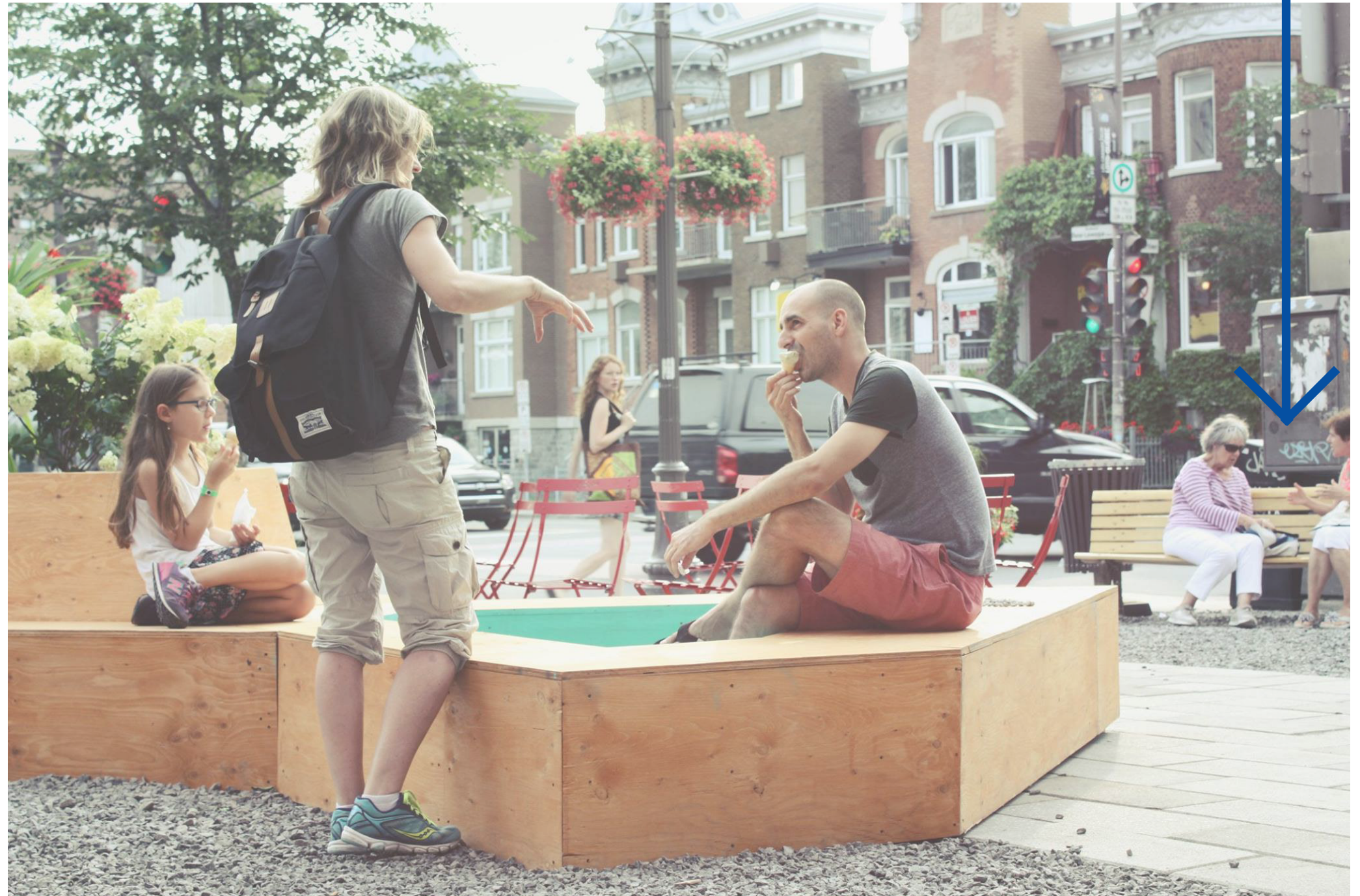
Le mobilier urbain à l'intérieur de l'aménagement temporaire à l'été 2015, à l'intersection de l'avenue Cartier/boul. René-Lévesque dans le quartier Montcalm.