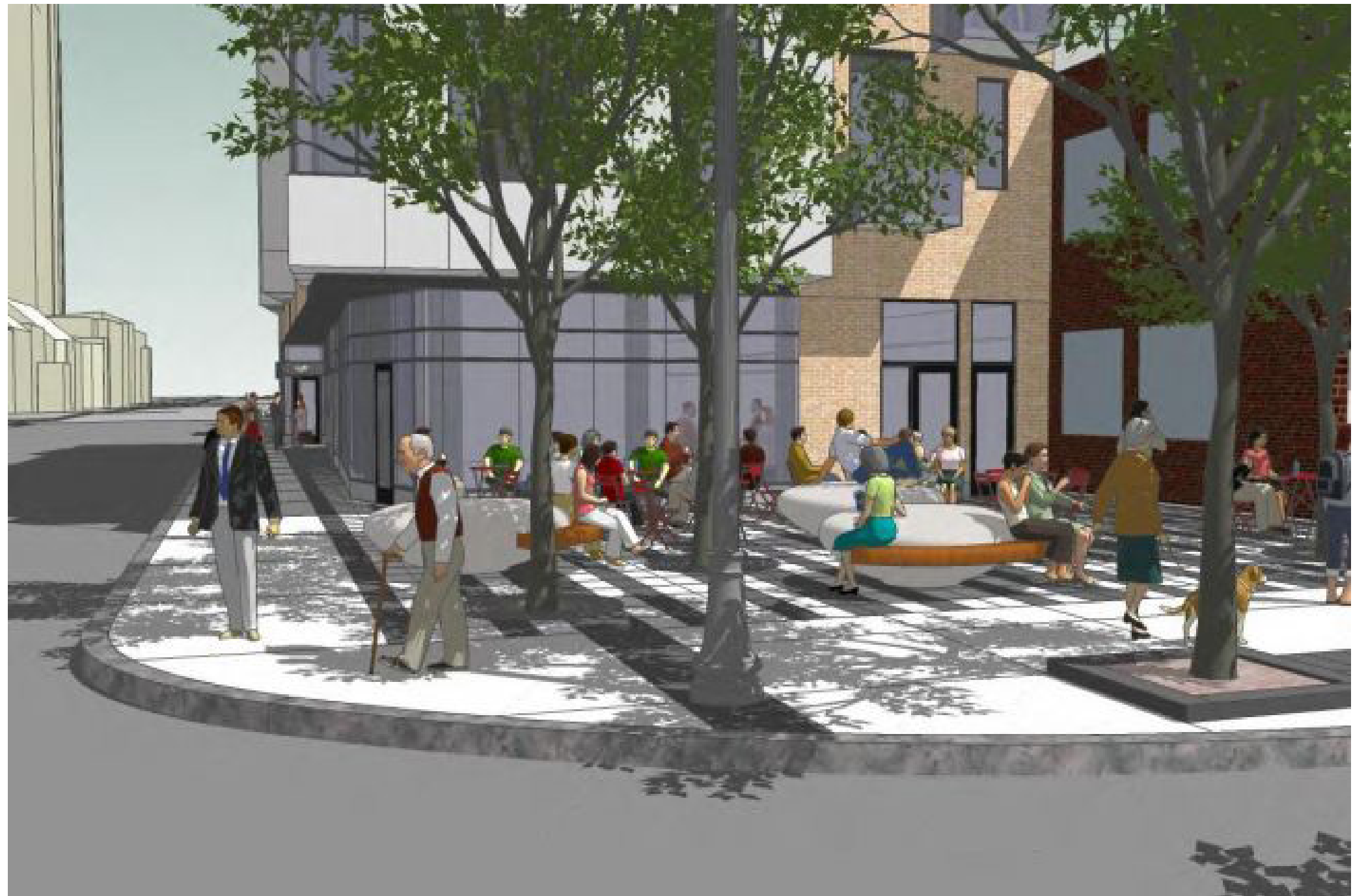
Concept d'aménagement permanent pour la place publique au coin de l'avenue Cartier et du boulevard René-Lévesque.