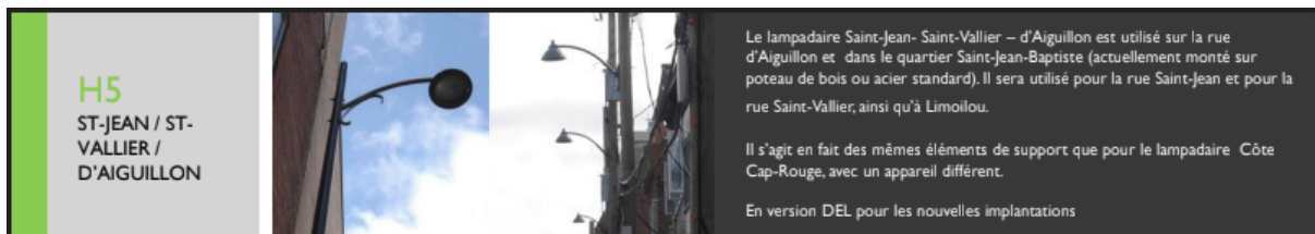
H5 à gauche, Cobra au centre.