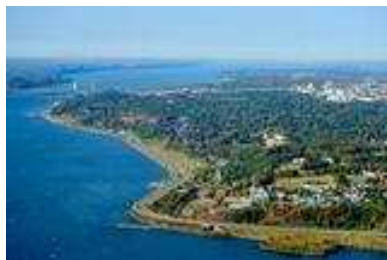
Site patrimonial de Sillery