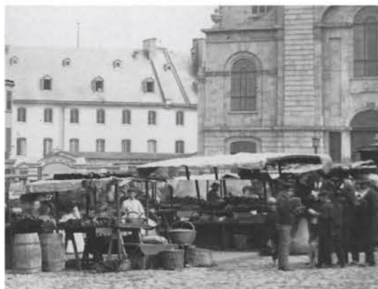
Marché de la Haute-Ville. 1869 (e6, s8, p404)