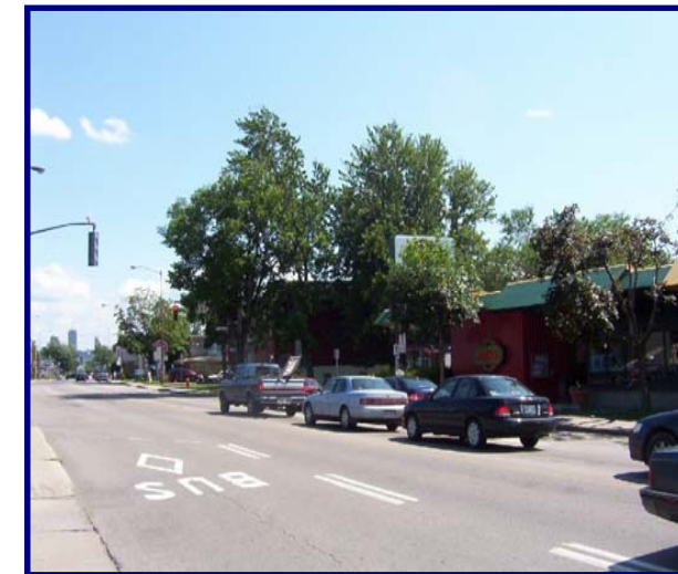
1 re Avenue

Au 7 décembre 2004, 195 000 $ du 900 000 $ avaient été dépensés pour les actions AU18 et CL69. En 2005, 450 000 $ furent accordés au réaménagement de la 1 re Avenue. En 2009, 100 000 $ furent utilisés pour le réaménagement du parc Marchand. Par conséquent, une somme de 155 000 $ est encore disponible pour aider à la réalisation d'actions prioritaires.