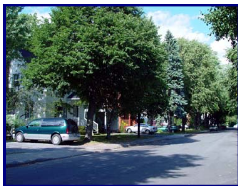
21 e Rue

Le plan d'action est un tableau qui est structuré selon les mêmes cinq thèmes que le document d'orientation : Aménagement urbain; Environnement; Développement économique; Culture, animation urbaine, loisirs et vie communautaire et Mise en œuvre du plan directeur du quartier.