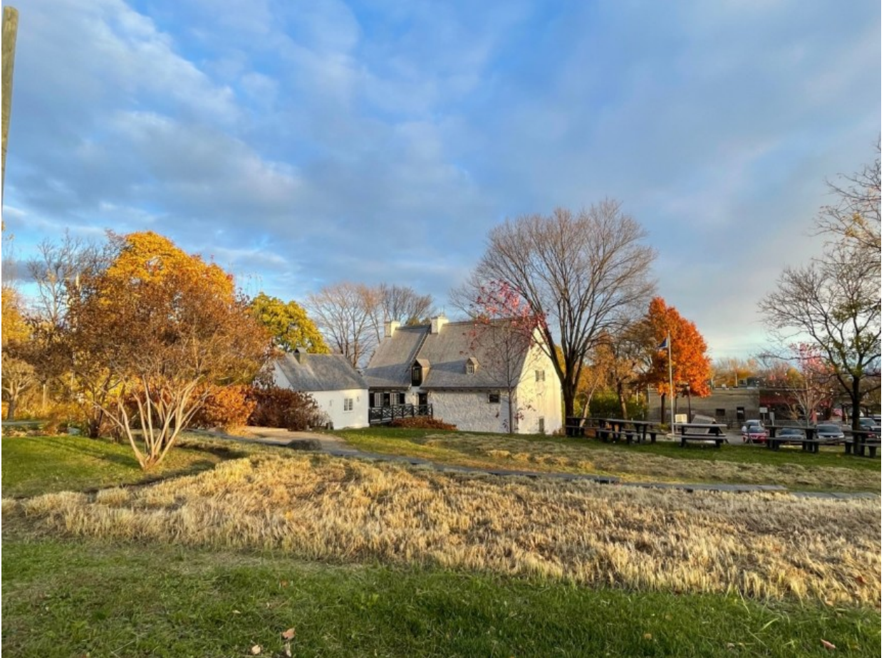
Le Moulin des Jésuites fait partie du paysage du quartier.

COMMUNAUTÉ. Le Conseil de quartier des Jésuites a dévoilé sa vision d'avenir à la suite des élections municipales, qui comprend notamment la modernisation des espaces verts pour favoriser la qualité de vie des citoyens.