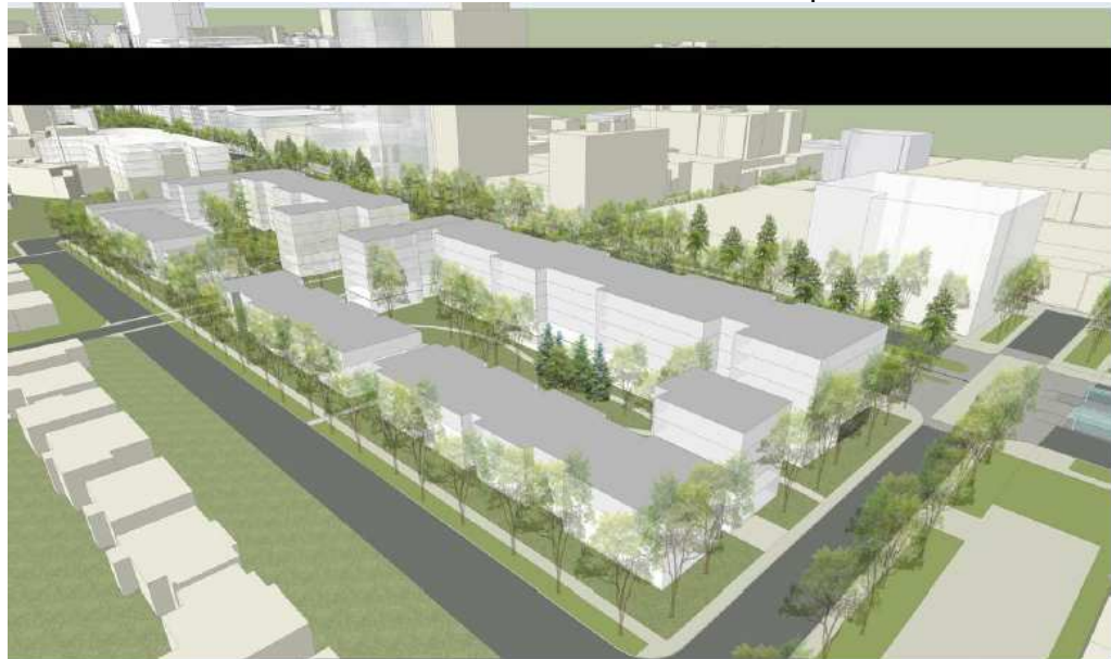
Illustration 1, Vue d'ensemble de la volumétrie de l'îlot Lapointe.

Les citoyens sont toujours inquiets sur ce dernier point étant donné que ceux-ci demandaient des entrées et sorties seulement sur le boulevard Laurier et aucune entrée et sortie sur les rues secondaires perpendiculaires à celui-ci. Les problèmes de circulation que les citoyens subissent présentement seront accentués si l'on permet l'ouverture des stationnements autrement que sur le boulevard Laurier. Le CQS va suivre ce point avec attention, car l'impact sera majeur pour tout le quartier. Un autre point à surveiller est celui du développement de l'îlot Lapointe qui devra se faire en respect avec les citoyens. Il faudra s'assurer que les propriétaires de maisons résidentielles ne soient pas pris en otage par les promoteurs. Des règlements de la Commission d'urbanisme et de conservation de Québec sont attendus en 2013 pour bien encadrer ce dernier point.