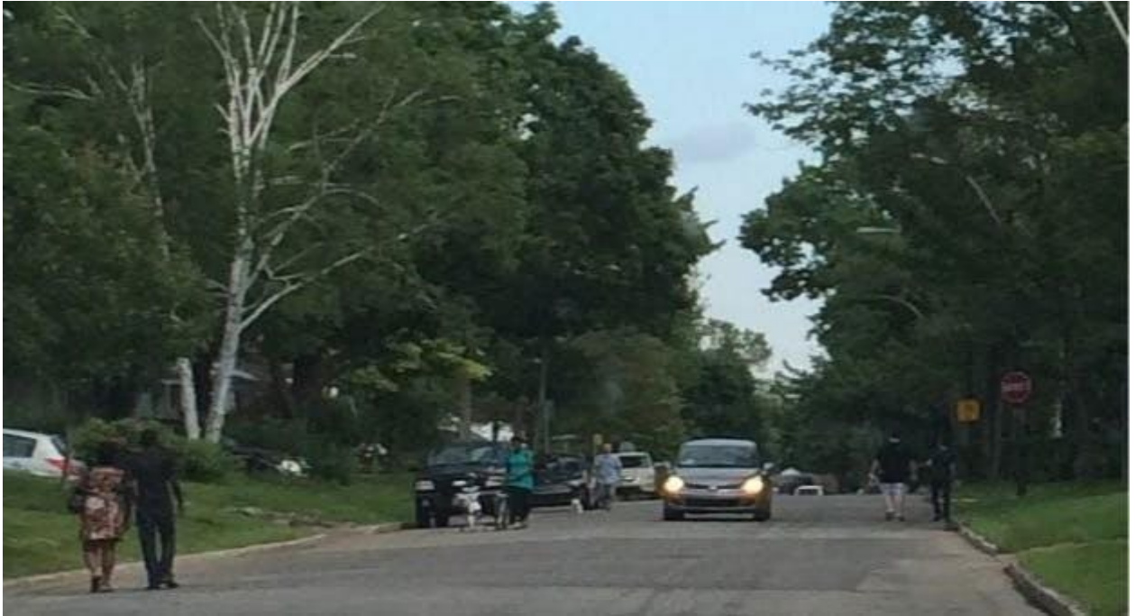
L'hiver est encore plus problématique pour les piétons. Photo du 11 janvier 2024.

Rue très passante du quartier, de nombreux piétons (dont élèves au primaire) marchent dans la rue alors que le trafic automobile est important. Améliorer la sécurité sur cette rue est prioritaire.