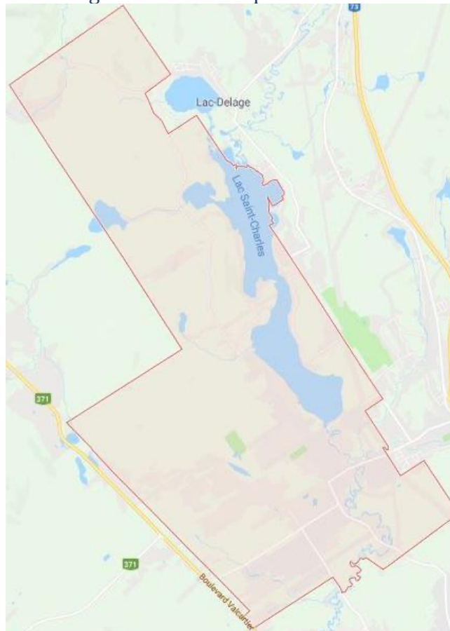
Figure 1: Carte du quartier