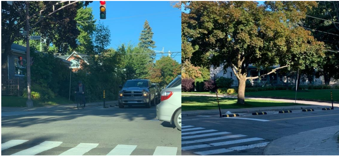
2. Exemples d'aménagement possible pour protéger la bande cyclable du chemin St-Louis aux intersections et autres endroits où la cohabitation pourrait être améliorée. Photo prise à Québec sur la 22 ième rue et ses intersections dans le quartier de Limoilou