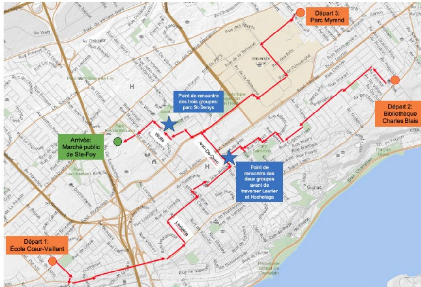
Affiche et trajets de la Balade des Élu.es 2023.

TRAJET: Carte présentant le trajet de la balade des élus. Il y a un point de départ de l'école Coeur-Vaillant, un autre de la bibliothèque de Sillery sur l'avenue Maguire et finalement un départ du Parc Myrand. Si vous avez des tout-petits qui ne peuvent faire l'ensemble du parcours, attendez-nous vers 11h20-11h30 au Parc St-Denys pour faire le dernier bout du trajet avec nous!