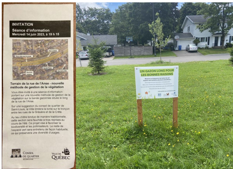
Dépliant et affiche concernant le projet de gestion différenciée de la végétation le long de la rue de l'Anse. Crédits : Marie-Hélène Felt.

secteur n'ont pas suivi les instructions reliées à ce projet de pré fleuri prévu par la Ville et plusieurs tontes ont eu lieu durant l'été. Le conseil espère de meilleurs résultats l'an prochain.