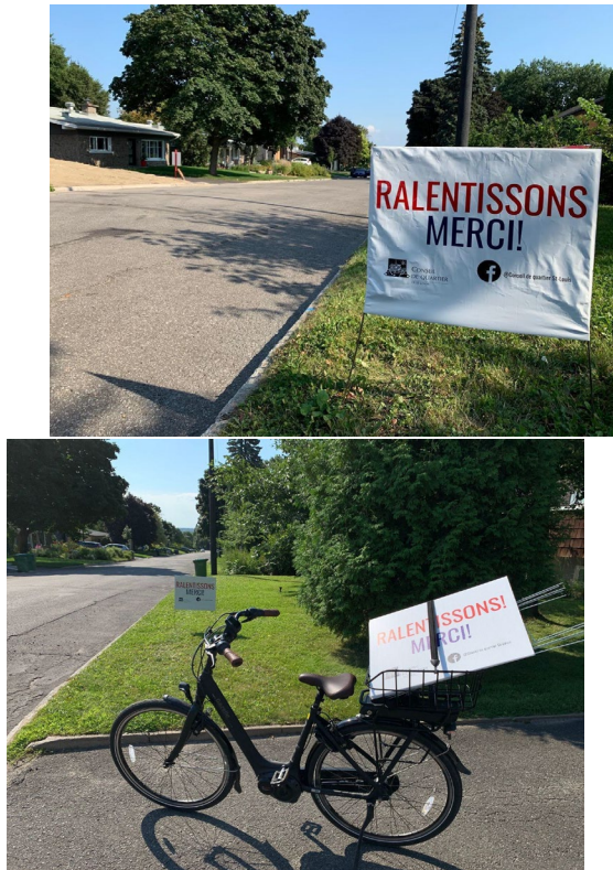
Panneaux Ralentiissons ! Merci ! visibles dans le quartier.

La distribution d'affiches à gazon avec le message Ralentiissons Merci ! fait encore cette année partie de nos initiatives. 50 affiches ont été distribuées au début de l'été lors des fêtes de la Saint-Jean et via le formulaire web (livraison à domicile par des membres du C.A.). Elles sont visibles sur les terrains de plusieurs résidences et rappellent aux gens de ralentir dans les rues du quartier.