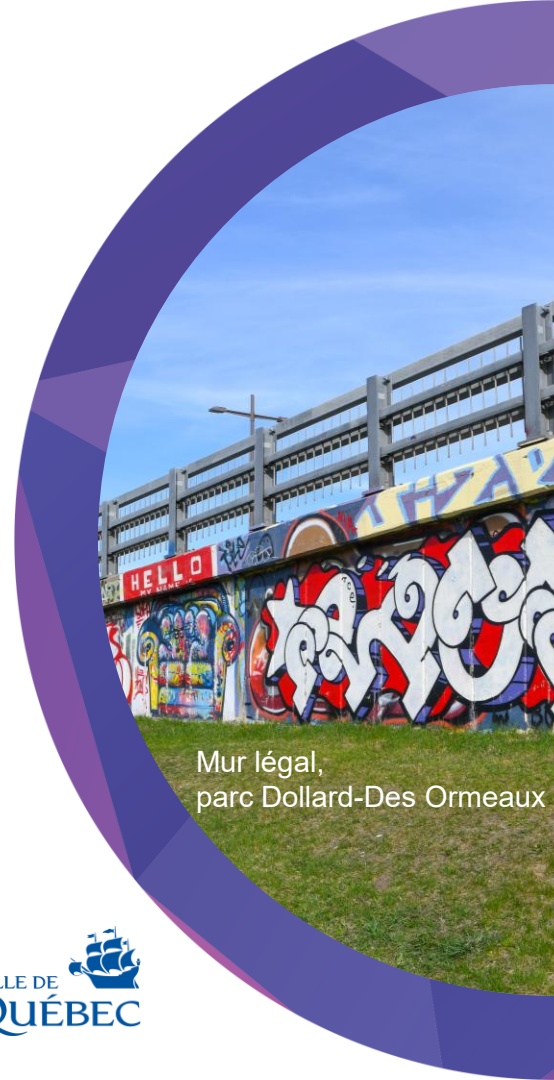
Mur légal, parc Dollard-Des Ormeaux