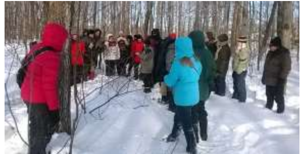
Activité du 17 janvier 2015

En février 2015, le CQPSF a collaboré à la préparation de l'activité Laisse ta trace, imprime un flocon dans le cadre du Carnaval du Campanile. Le 7 février 2015, en compagnie de Bonhomme et des duchesses, les administrateurs du CQPSF ont eu l'occasion d'échanger avec les citoyens dans un contexte festif. Le CQPSF a apprécié la collaboration avec les organisateurs de l'activité du Campanile et la Ville de Québec pour la réalisation de l'événement.