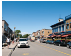
L'avenue Maguire, secteur commercial, dans le prolongement de la côte de Sillery.

Information: Société de développement commercial Maguire 418 952-9994, sdcmaguire@bellnet.ca