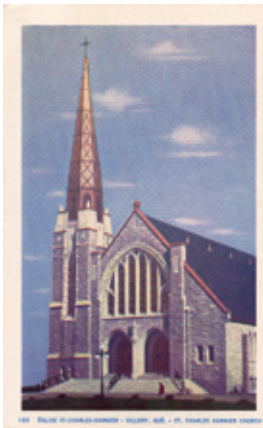
Église Saint-Charles-Garnier de style néogothique. 1215, avenue du Chanoine-Morel Carte postale: © Lorenzo Audet, vers 1950.

Réservation obligatoire: Société d'histoire de Sillery 418 641-6664, histoiresillery.org