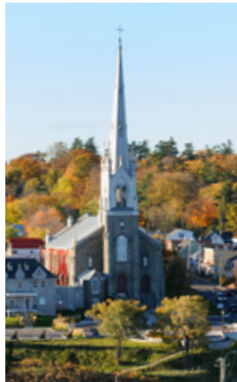
Église Saint-Michel-de-Sillery ouverte au culte en 1854. 1600, rue du Cardinal-Persico