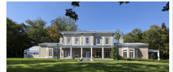
La villa du domaine Cataraqui d'inspiration néoclassique érigée en 1856.

Réservation obligatoire: Société d'histoire de Sillery 418 641-6664, histoiresillery.org