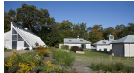
Une partie des serres du domaine Cataraqui reconnu monument patrimonial dès 1975.

Lieu: 2101, ch. St-Louis, domaine Cataraqui, Atelier du Peintre