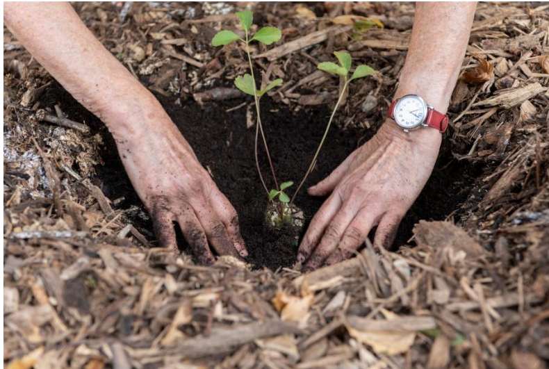
Mise en terre d'un plant lors de la journée de plantation.