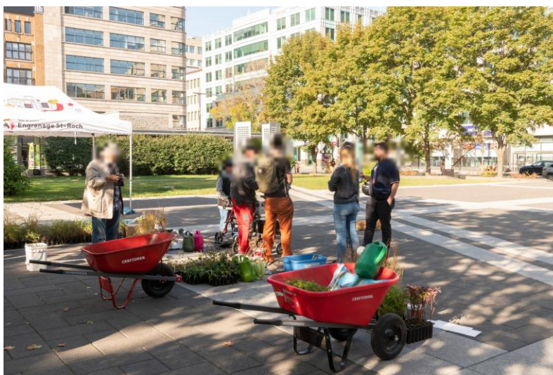
Journée de plantation à la Place de l'Université du Québec — l'Engrenage Saint-Roch et le voisinage réunis pour le verdissement.

Le projet retenu a été le verdissement de carrés d'arbre du quartier lors d'une journée de plantation avec le voisinage du quartier.