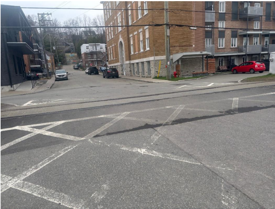
Photo : Les réparations effectuées pour traverser la voie ferrée (113 e Rue).