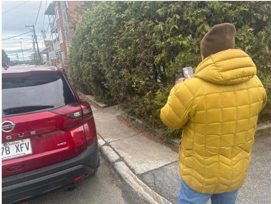
Photo : Une haie qui empêche d'emprunter le trottoir, notamment pour les fauteuils roulants. Le trottoir est beaucoup trop étroit par la suite (coin 113e Rue/rue Henri-Talbot).