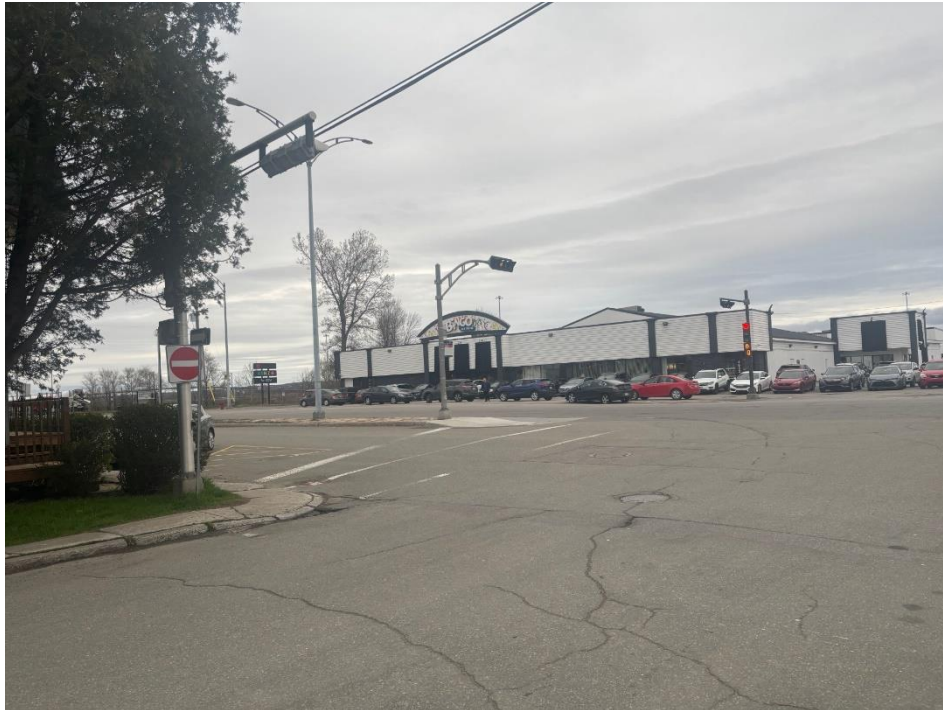
Photo : Un arrêt d'autobus situé entre le boulevard Ste-Anne et l'avenue St-Grégoire : des enjeux de sécurité et d'accessibilité.